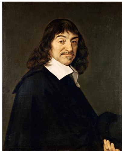
Fig. 4: Descartes.

Entrambe le agenzie forensi hanno dato come risultato il massimo di corrispondenza facciale fra questi due esempi e il dipinto ritrovato a Parigi; in particolare la Nationaal Forensisch Onderzoeksbureau (NFO) ritiene si tratti della stessa persona. L'antiquario Wecht ha chiesto poi a vari studiosi di dire la loro, causando un dibattito ancora in corso. Ad esempio Eric Schliesser nel suo blog afferma che sebbene somigli allo Spinoza da sempre raffigurato, non si capisce come mai lo sfondo e le immagini attorno siano di pura fantasia e non riflettano invece qualcosa del filosofo, ad esempio non ci sono lenti o arnesi di fresatura oppure libri in vista ma solamente la visuale di un paesaggio di natura classica e una statua alle spalle; in più Spinoza sembra avere un drappo addosso alla maniera degli antichi romani. Egli si chiede anche perché avrebbe dovuto posare per un pittore in quella maniera e non da filosofo, visto che spesso, in quel periodo, i grandi pensatori si facevano dipingere con uno sfondo completamente nero. Tuttavia il giorno dopo il post appena pubblicato, l'autore si reca personalmente a vedere il dipinto e cambia idea, affermando - in un nuovo post - che si tratta invece proprio di Spinoza e che probabilmente è il quadro della Herzog August Bibliothek a Wolfenbüttel quello che è idealizzato e con uno sfondo nero eguale alle rappresentazioni dei due autori altrettanto famosi: Descartes ed Hobbes (Figg. 4 e 5).